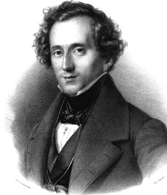
Felix Mendelssohn Bartholdy 1809 - 1847